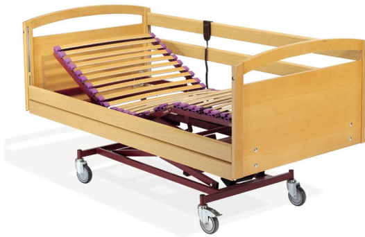
Ref. SYN0090CE Cama SYNCRO 4 pl.