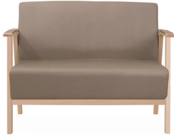
Ref. UNND021MB Sofá respaldo bajo UNIVA