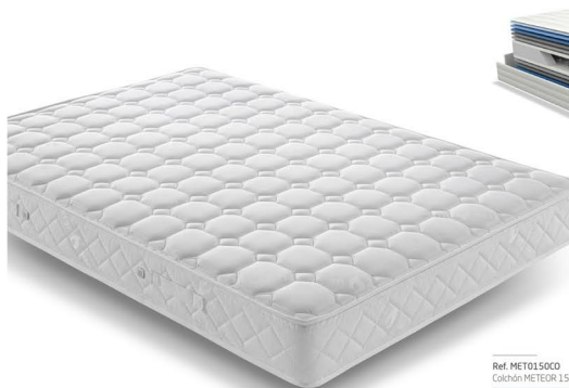
Ref. MET0150CO Colchón METEOR 150

1' y 2' Tapa: Tejido: Jacquard Flame Retardant Foam: 26 mm Fibra: 150 gr Feltro: 1100 gr Núcleo: Muelle: 2.3 Box Bonel Platabanda: Tejido: Jacquard Flame Retardant Fibra: 160 gr TNT: 30 gr Cinta vivo: Blanca Asas: 2+2 Alreadores: 2+2