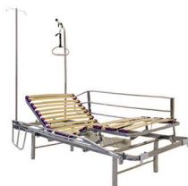
Ref. TEC0090PR Cama TECNO CLINIC 4 planos 90x190 + pata regulable