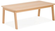
Ref. UNND024MB Mesa centro UNIVA