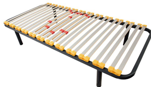
Ref. GCF009050 - GCF000150 Somier GRAN CONFORT 90 + juego de patas GRAN CONFORT