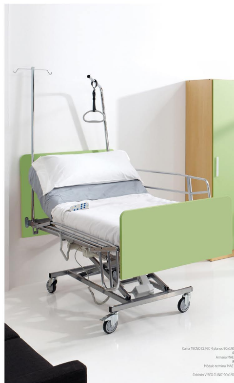
R Cama TECNO CLINIC 4 planos 90x190 Ref. Armario MAE 1 Ref. Módulo terminal MAE c Ref. Colchón VISO CLINIC 90x190