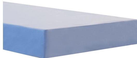
Ref. BCL0090HR Colchón BASIC CLINIC