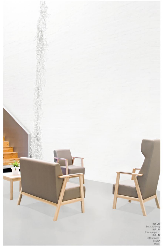
Ref. UN Butaca UNNA p Ref. UN Butaca respaldo Ref. UN Sofá respaldo Ref. KA Piseta