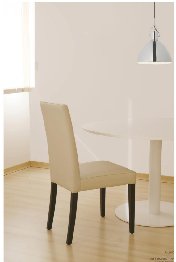
Ref. LIU0 Ref. KIS0003BL + TAP Tabla KIS0003BL