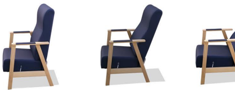
Ref. UNN0013MB Butaca respaldo alto UNNA movimiento

es - Todo el confort de los sillones UNNA con el añadido del movimiento suave del respaldo mediante mecánicas. en - The whole comfort of the armchairs UNNA with the added soft movement of the backrest by means of gears. fr - Le confort de l'ensemble de fauteuils UNNA avec l'ajout du mouvement doux du dossier par un mécanisme.