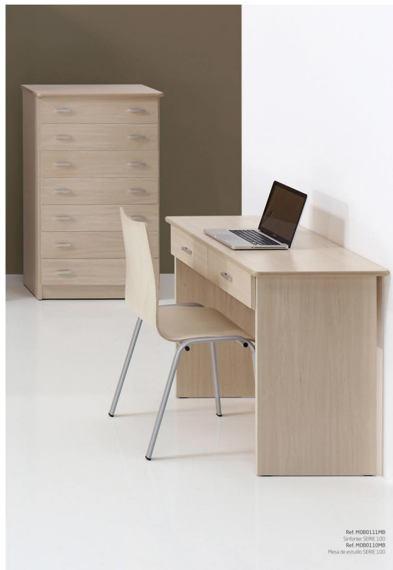
Ref. MOB0111MB Sillón SERIE 100 Ref. MOB0110MB Mesa de estudio SERIE 100